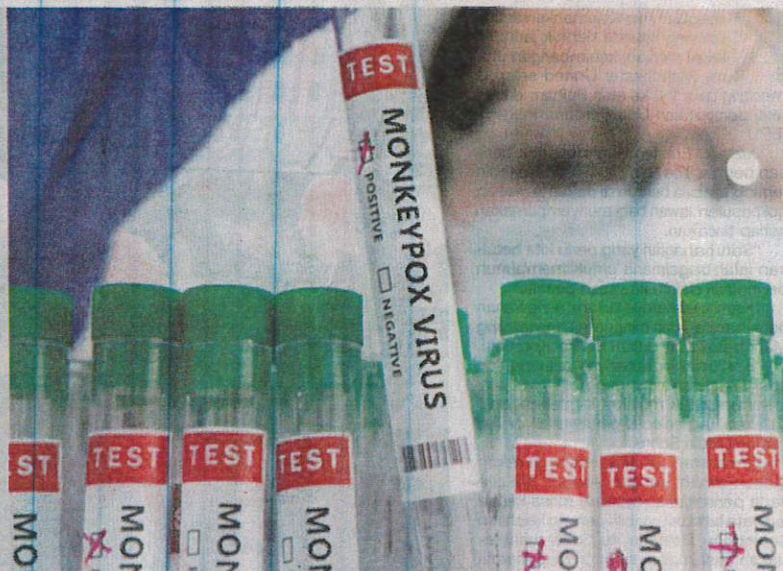
Sampel mpox yang diambil dari pesakit untuk tujuan kajian bagi mencipta vaksin.

"Tidak menghairankan... Perjalanan antara benua telah membawanya ke Eropah," kata