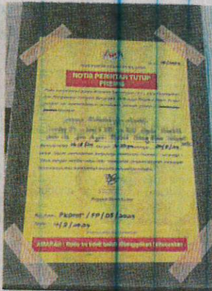
Notis penutupan sementara kafe di KPM Ayer Molek, Tiang Dua selama 14 hari.

Bagaimanapun, katanya, seorang daripada pelajar dimasukkan ke wad selepas dibawa oleh bapanya ke hospi-